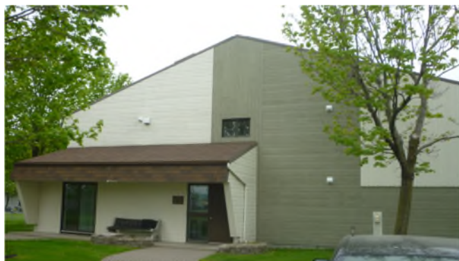
C.M.H. de St-Bernard en mai 2016