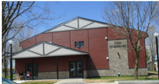
C.M.H. de St-Bernard en octobre 2017

Centre de services de Thetford Mines Ouverture juin 2009